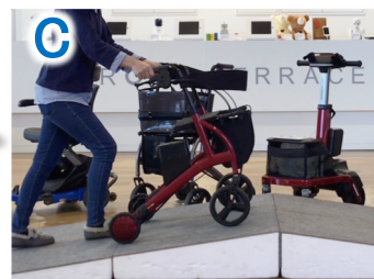
【モビリティ】電動アシストカートの移動補助体験

3つのグループに分かれて、3つのメイン体験プログラムを順番にご体験いただきます。フリータイムでは、スマートリビングや見守りロボットなどもご見学いただけます。※各コーナーにてスタッフがご案内いたします。