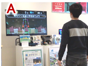
【TANO】大きなモニターで楽しく運動ゲーム体験