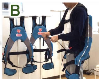
【アシストスーツ】マッスルスーツなどの装着体験